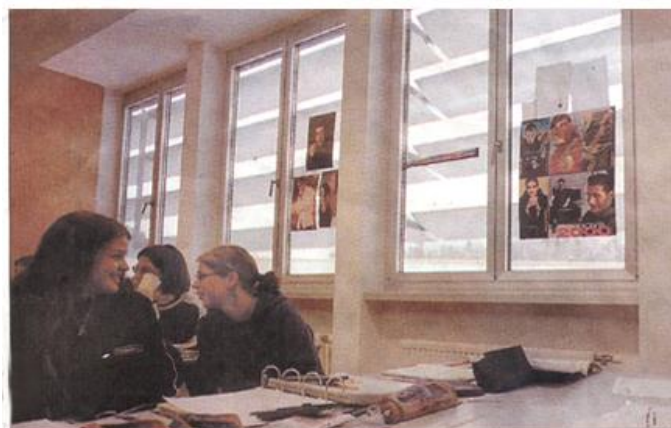
Die Schüler verpicken zum Schutz vor störender Blendung die Fenster.

Bei der Aufstellung sollte darauf geachtet werden, dass bei Rechtshändern das Licht von links kommen soll (Linkshänder eher in der Raumtiefe oder zwischen Fenster setzen, wo das Streulicht vorherrscht).